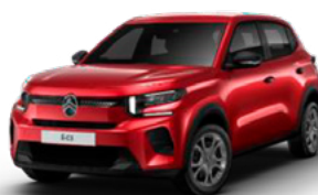
ELIXIR RED (EVH)