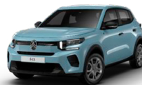
BLEU MONTE CARLO (KRA)