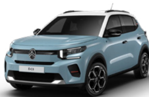
OPAL WHITE z lakierem BLEU MONTE CARLO