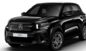
PERLA NERA BLACK (KTV)