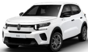
POLAR WHITE (EWP)