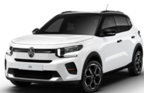
PERLA NERA BLACK z lakierem POLAR WHITE