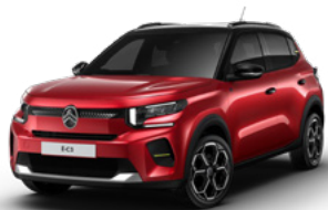
PERLA NERA BLACK z lakierem ELIXIR RED