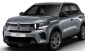
MERCURY GREY (ESX)