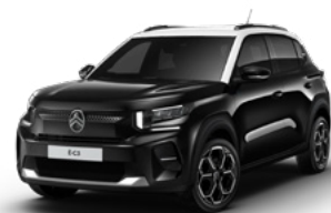
OPAL WHITE z lakierem PERLA NERA BLACK