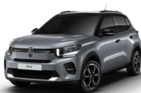
PERLA NERA BLACK z lakierem MERCURY GREY