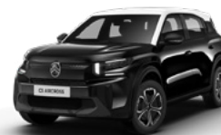
OPAL WHITE z lakierem PERLA NERA BLACK