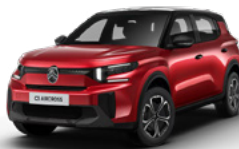
PERLA NERA BLACK z lakierem ELIXIR RED