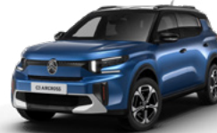
PERLA NERA BLACK z lakierem BRIGHT BLUE