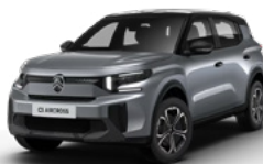
PERLA NERA BLACK z lakierem MERCURY GREY