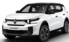
PERLA NERA BLACK z lakierem POLAR WHITE