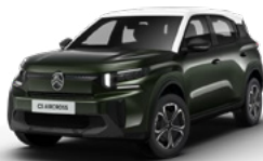
OPAL WHITE z lakierem MONTANA GREEN