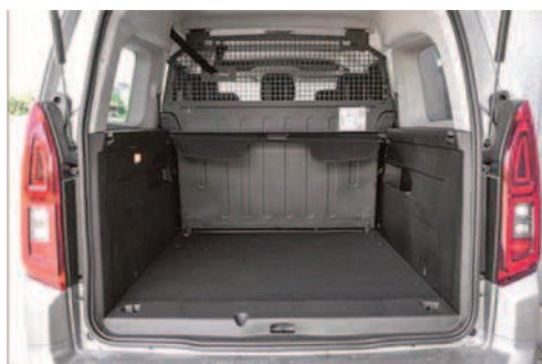
Przegroda stała za drugim rzędem siedzeń

VDA - norma obliczania pojemności bagażnika przy pomocy prostopadłościanów o wymiarach 200 x 100 x 50 mm.